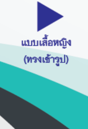
แบบเสื้อหญิง (ทรงเข้ารูป)